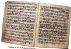
Quintet en sol H. (Hobday)

Adagio, doloroso. Une fois libéré, Saint-Georges se rend à Saint-Dominique pour servir la cause des abolitionnistes et celle de la Révolution. Mais il est pris au milieu des luttes intestines entre Blancs et Noirs et quitte l'île, profondément épuisé. À Paris, Saint-Georges reprend ses activités de musicien, pour peu de temps malheureusement, car il tombe malade et meurt le 10 juin 1799.